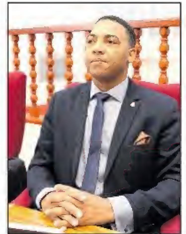
purba na soluciona, pa purba na pone un paro, pa purba na limita e abuso contra di nos muchanan.

becindario. Tambe prome minister cu ta tras di tur su ministernan pa atraves di presupuestonan tambe, e fondonan wordo poni, pa tur e desaroyonan aki keda haya sosten. Y sigur sigur, no por lubida e minister di asuntonan social, cu a bin ta carga e antorcha di social crisis plan cu entre otro ta haya e Child Protective System den dje, Bureau Sostenemi, cu e ministerio aki a bin ta carga pa completa e plan integral cu Gabinete Wever-Croes ta bin ta atendiendo cun'e, pa